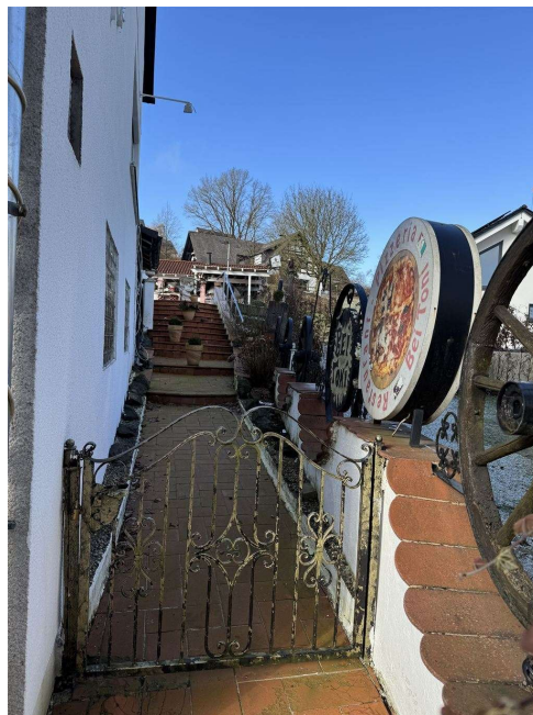
Aufgang zum Biergarten