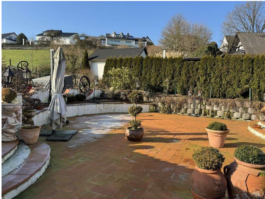
Biergarten_freie Sitzfläche (vor Frühjahrs-Putz)