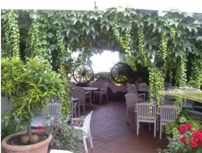
überdachter Biergarten (Sommerzeit)