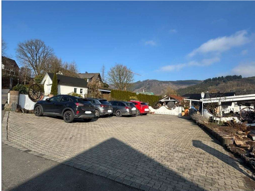
weiterer Parkplatz neben Biergarten