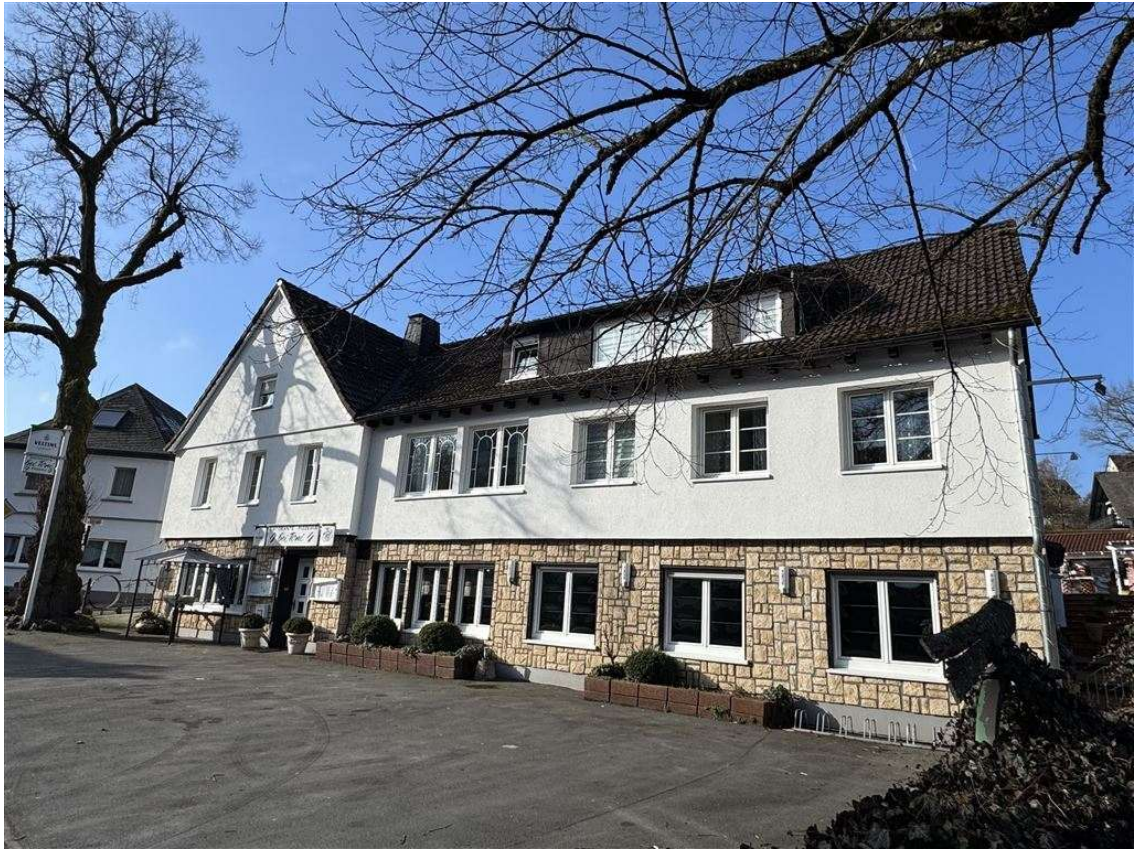
Mathmeckestraße 4, 59889 Eslohe (Sauerland)