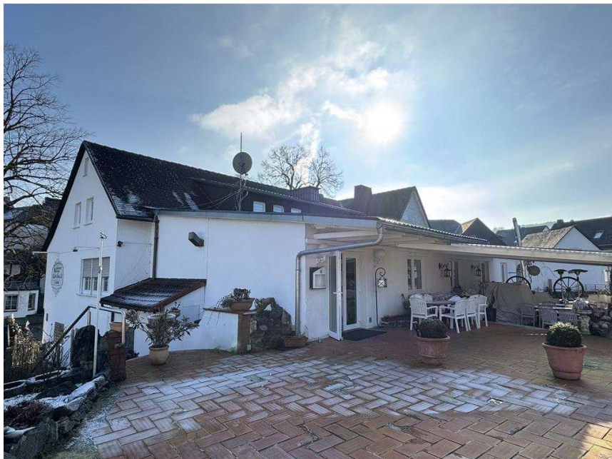
hinterer Eingang zum Festsaal